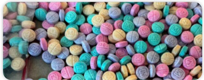
*Pastillas arcoíris FALSAS de oxycodona M30 que contienen fentanilo